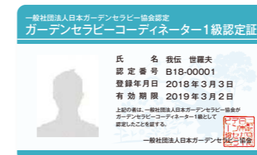
※ライセンスカードはイメージです

協会認定のライセンスカードが発行されます。協会ホームページにライセンス保有者の氏名を掲載させていただきます。その他、名刺などのオリジナルノベルティをご利用いただけます。